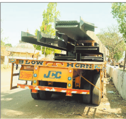
दुर्घटनाकारित ट्रेलर वाहन।