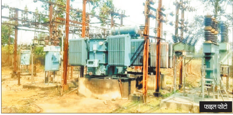
हरिभूमि न्यूज ►► कोरबा

जिले में छत्तीसगढ़ बिजली वितरण कंपनी अंतर्गत चल रहे 55 सब स्टेशनों से कॉट्रेक्ट ऑपरटर बेमुहूत हड़ताल पर चले गए। सब स्टेशन कर्मियों को लंबे समय से पीएफ की राशि नहीं मिली है जिसके चलते कर्मचारी अवकाश पर चले गए हैं जिससे विद्युत विभाग के अधिकारियों का टेंशन बढ़ गया है क्योंकि कर्मी बढ़ने से लगातार सब स्टेशनों में लोड बढ़ गया है। हालांकि अधिकारियों ने सब स्टेशन में बिजली कर्मचारियों को तैनात किया है।