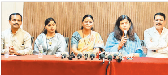
प्रेसवार्ता को संबोधित करतीं सुशी सरोज पांडेय व अन्य।

प्रेस वार्ता को संबोधित करते हुए भाजपा की राष्ट्रीय उपाध्यक्ष सरोज पांडेय ने कहा कि सखी सहेली महिला समूह द्वारा आयोजित होने वाला यह विशेष कार्यक्रम 12 अप्रैल को शाम 4 बजे से 8 बजे तक अशोक वाटिका में आयोजित किया जाएगा। यह आयोजन खास तौर पर उन महिलाओं के लिए है, जो अपनी व्यस्त दिनचर्या में खुद को और अपने बचपन की खुशियों को नहीं पीछे छोड़ चुकी हैं। आज के तनावपूर्ण जीवन में महिलाएं