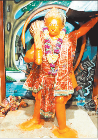
हरिभूमि न्यूज ►► कोरबा