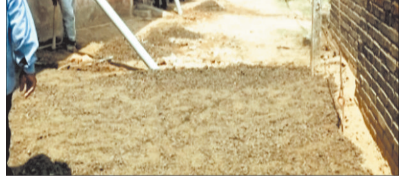
सड़क मरम्मत कार्य।