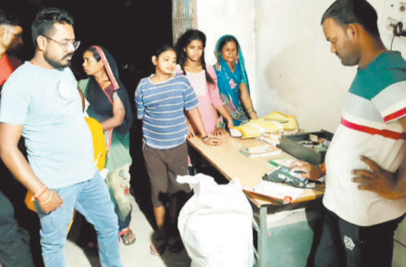
पीडीएस दुकान में राशन लेते हितग्राही।

राशन दुकान में हितग्राहियों की भीड़ लगी रही। बुजुर्ग, महिलाएं, पुष्प सभी सुबह से लेकर देर रात तक चावल शक्कर नमक एवं चना पाने के लिए लाइन पर लगकर अपने पारी आने का इंतजार करते रहे वहीं दुकान संचालक विक्रेता भी सेवा देते हुए किसी का राशन न छूट जाए यह सोचते हुए 10 बजे रात तक