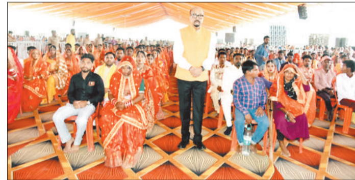
सामूहिक विवाह में उपस्थित महामहिम राज्यपाल।

राज्यपाल रमन डेका कटघोरा क्षेत्र अंतर्गत ग्राम ढपढप-बांकीमोंगरा में आयोजित दिव्य श्री हनुमंत कथा एवं 108 दिव्यांग एवं निर्धन कन्याओं के